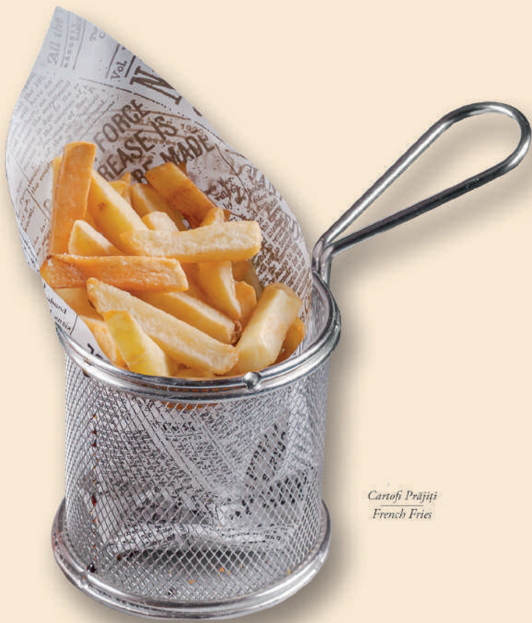
Cartofi Prăjiți French Fries

Prețurile afișate sunt în lei și includ TVA / The prices are in Lei and include VAT