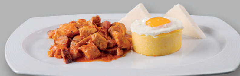
Tochitură Românească Traditional Stew

Prețurile afișate sunt în lei și includ TVA / The prices are in Lei and include VAT