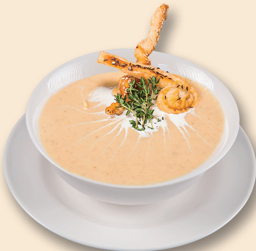
Supă Cremă de Legume Vegetables Cream Soup

Prețurile afișate sunt în lei și includ TVA / The prices are in Lei and include VAT