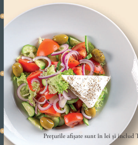
Salată Grecească Greek Salad

Lettuce with Tomatoes, Cucumber, Red Onion, Feta Cheese, Green Olives and Oregano