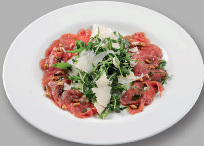
Carpaccio di Manzo