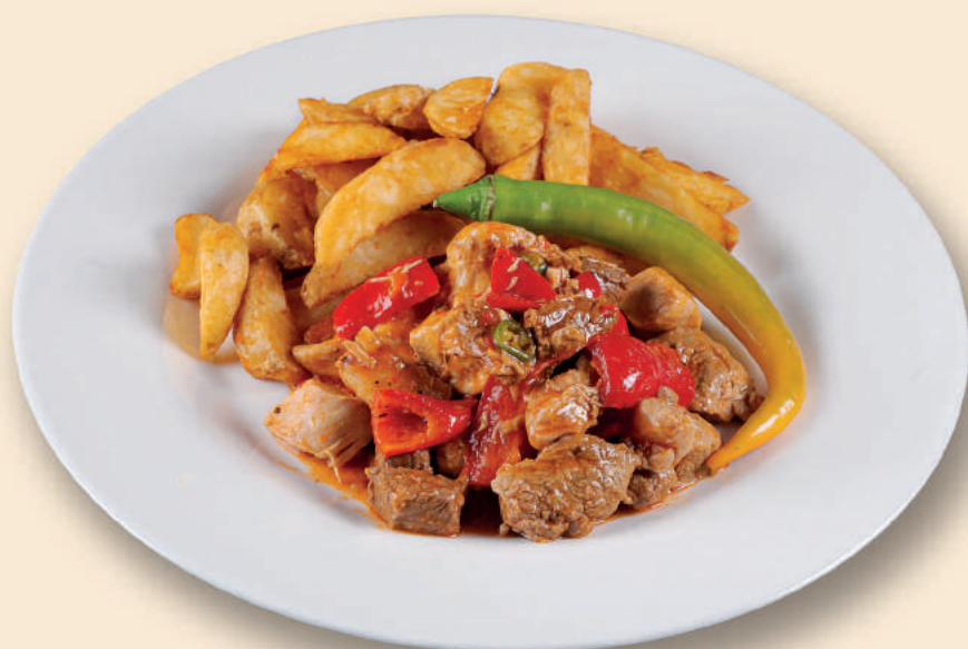
Tigaie Picantă Spicy Skillet

Traditional Cabbage Rolls with Crispy Bacon, Polenta, Hot Pepper and Sour Cream