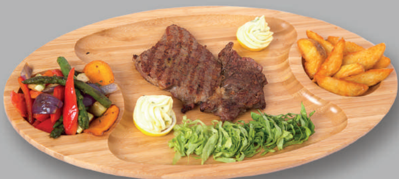
Antricot de Vită Rib Eye Steak