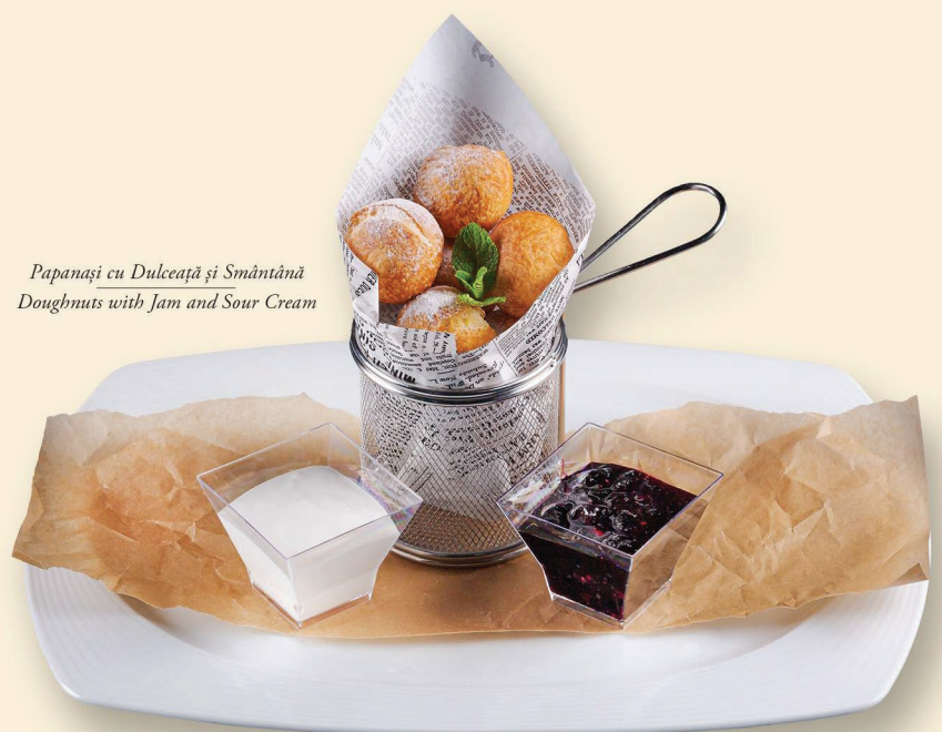
Papanași cu Dulceață și Smântână Doughnuts with Jam and Sour Cream

Prețurile afișate sunt în lei și includ TVA / The prices are in Lei and include VAT