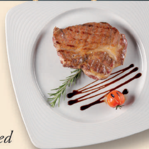
Ceafă de Porc Pork Neck