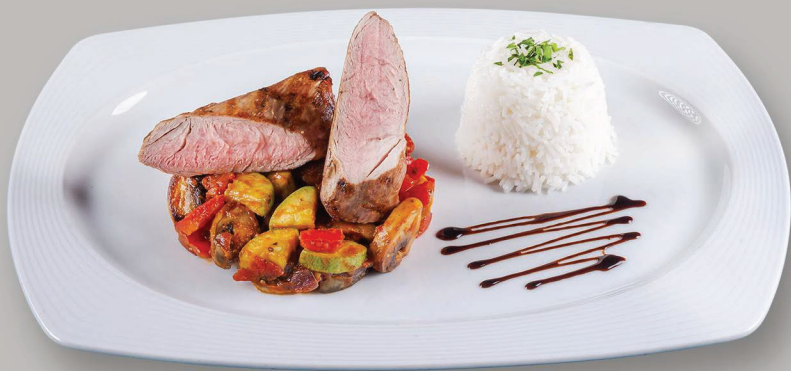
Muşchiuleţ de Porc Mediteranean cu Risotto Mediterranean Pork Tenderloin and Risotto