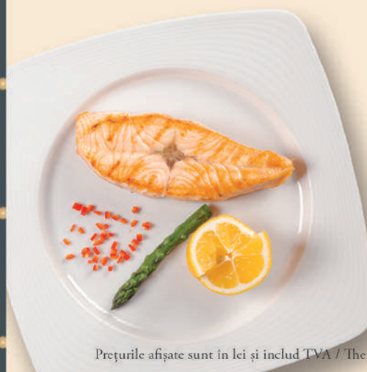
File de Somon Salmon Fillet

Prețurile afișate sunt în lei și includ TVA / The prices are in Lei and include VAT