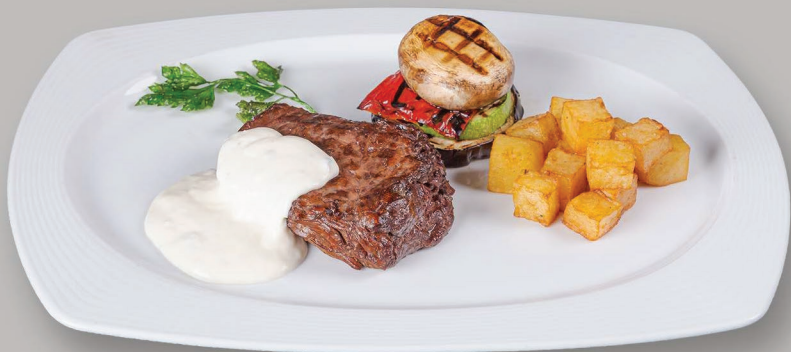
Muşchi de Vită cu Sos Gorgonzola Beef Tenderloin with Gorgonzola Sauce