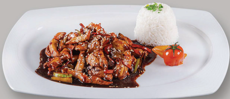
Pui Asiatic Asian-Style Chicken