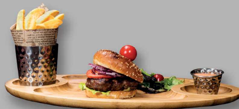
Homemade Classic Burger