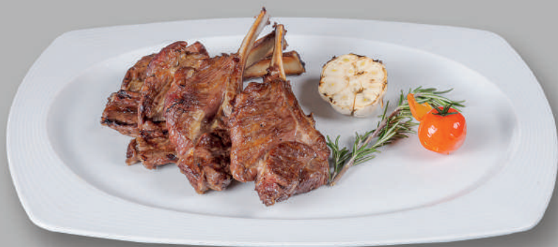
Cotlet de Miel Lamb Chops