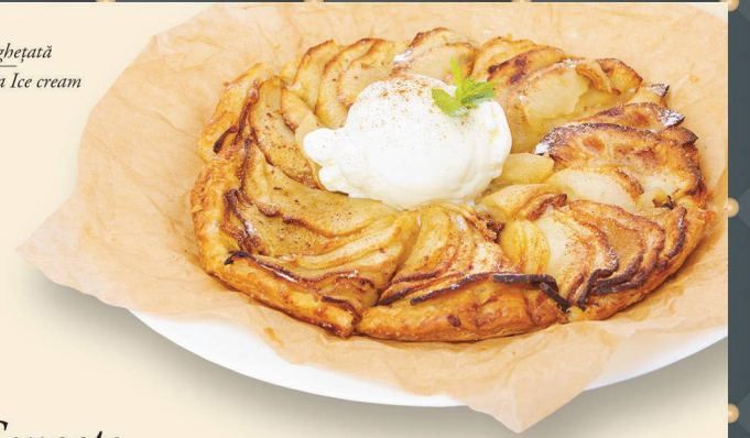
Tartă cu Mere și Înghețată Apple Cake with Vanilla Ice cream