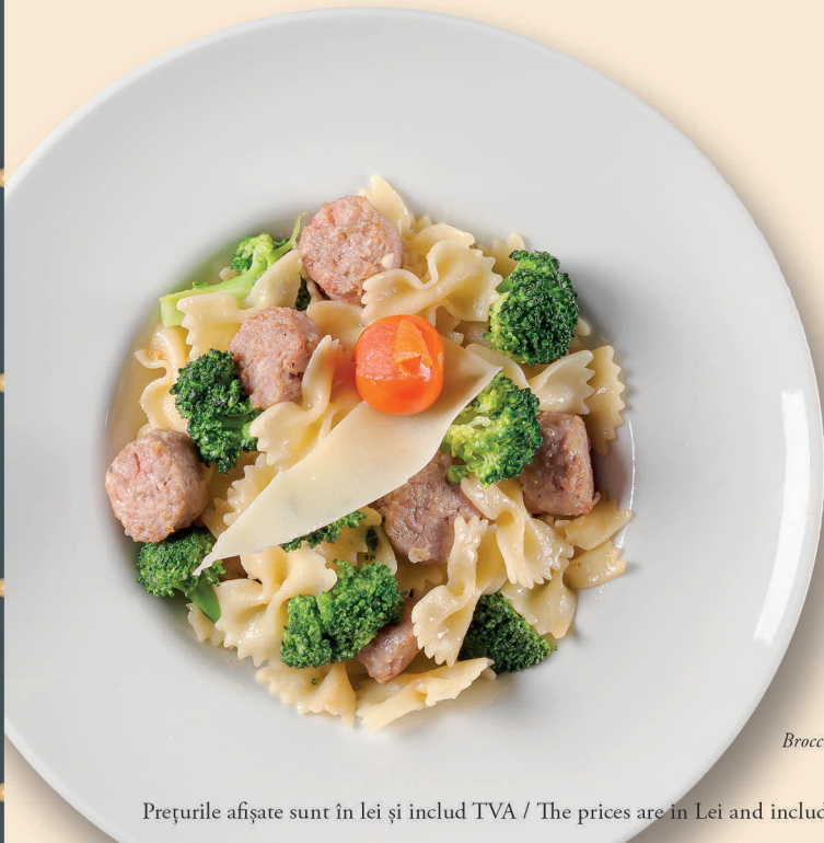
Broccoli & Salsiccia

Broccoli, Salsiccia, Unt, Parmesan, Usturoi și Vin Alb Broccoli, Salsiccia, Butter, Parmesan, Garlic and White Wine